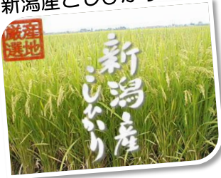
新潟産こしひかり

南富士CCではゴルフ用品からもらって家族にもうれしい地元名産品等各種食材まで 幹事様のご要望に合わせて様々なバリエーションで準備可能です!